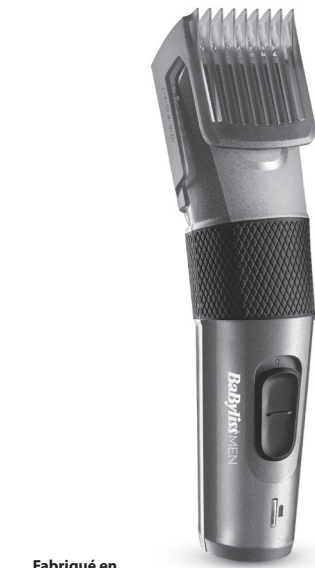
Fabriqué en Made in China