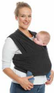
TRICOT • SLEN design