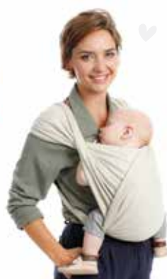
TRI • COTTI