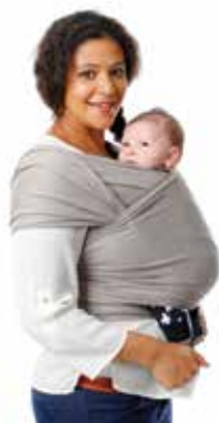
TRICOT • SLEN organic