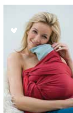
BB • SOOZE

WASINSTRUCTIES/INSTRUCTIONS DE LAVAGE/WASCHEN/WASHING INSTRUCTIONS/INSTRUCCIONES DE LAVADO/ISTRUZIONI PER IL LAVAGGIO/TVÄTTRÅD/ΟΔΗΓΙΕΣ ΠΛΥΣΙΜΑΤΟΣ