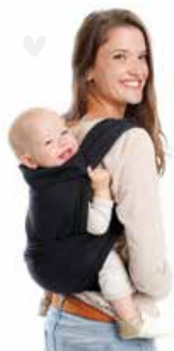
BB • TAI