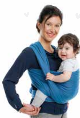
BB • SLEN