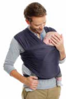
TRICOT • SLEN cool