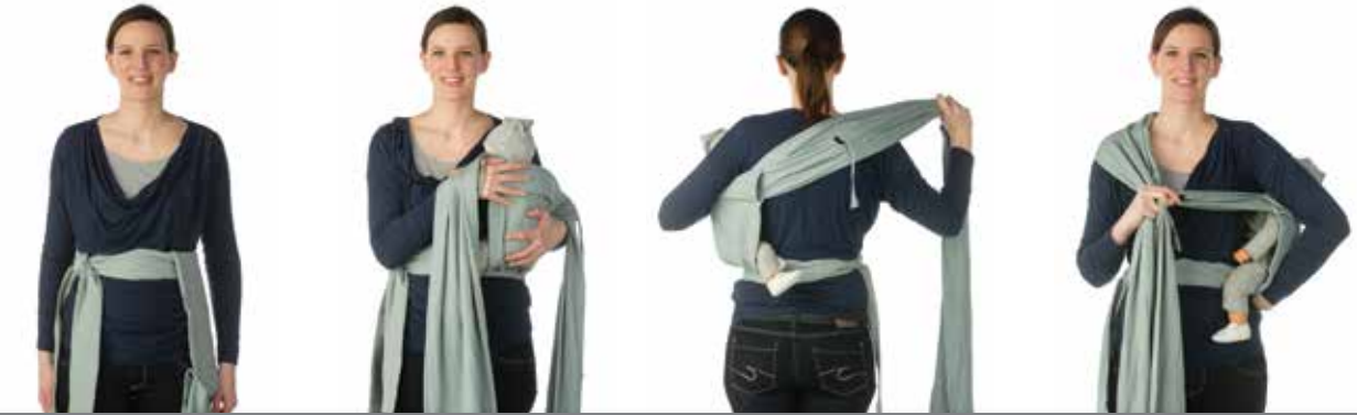
1 2 3 4