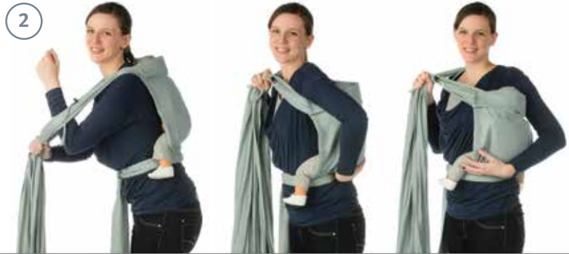
1 2 3