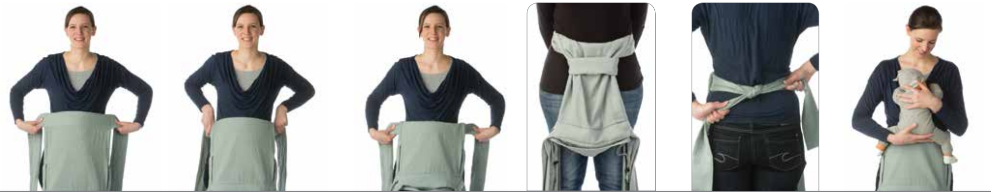
1a 1b 1c 1d 2 3

Δέστε τη ζώνη στη μέση, ακριβώς κάτω από το στήθος σας ή ελαφρώς χαμηλότερα ανάλογα με το σώμα σας και το μέγεθος του μωρού σας (εικόνα 1α). Ίσως χρειαστεί να διπλώσετε τη ζώνη μια φορά (εικόνα 1β) ή δύο φορές (εικόνα 1c). Χρησιμοποιήστε το πρόσθετο μαξιλαράκι (1d) σε περίπτωση που χρειάζεται να ρυθμίσετε το πλάτος ώστε να ταιριάζει σωστά από γόνατο στο γόνατο.