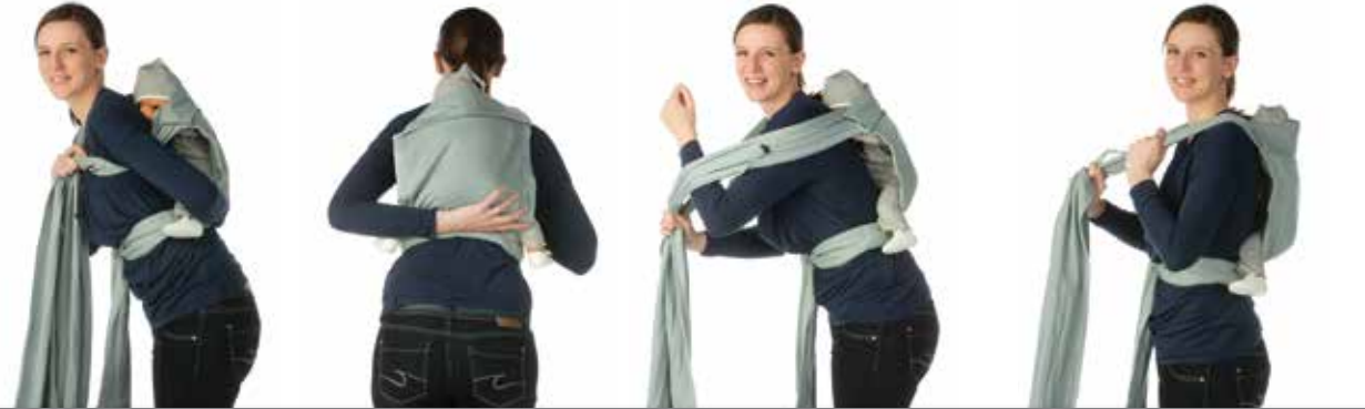
5 6 7 8