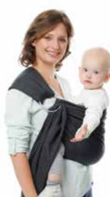
BB • SLING