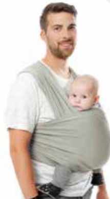
TRICOT • SLEN bamboo