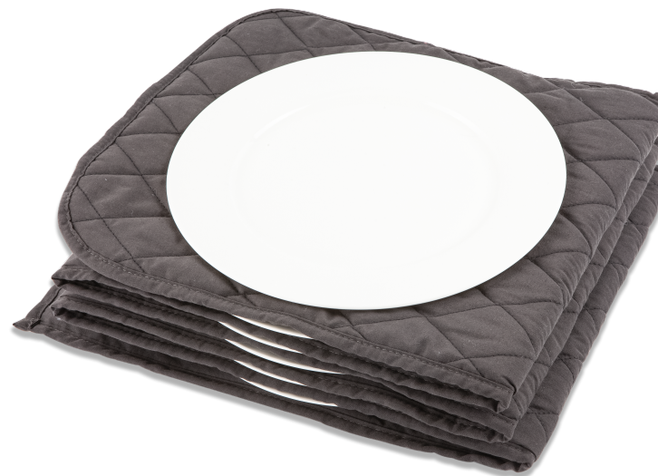
PLATE WARMER BR-2209

Read this manual carefully and use the unit correctly as described in the manual Keep the manual for future reference.