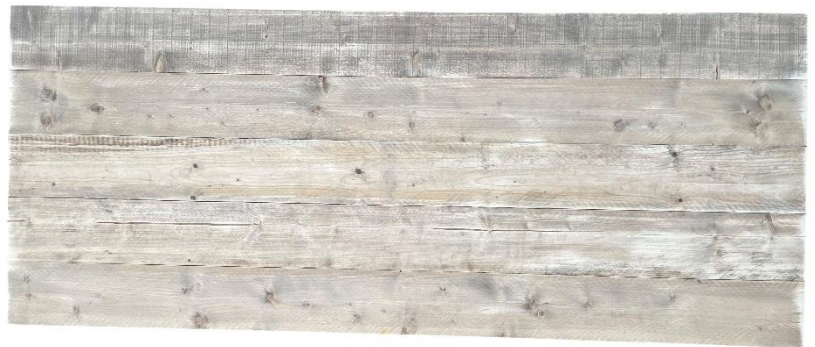
1x Bureaublad + schroeven